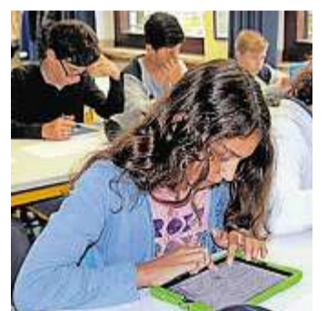
An den Privaten Schulen Pindl wurden iPad-Klassen eingeführt.