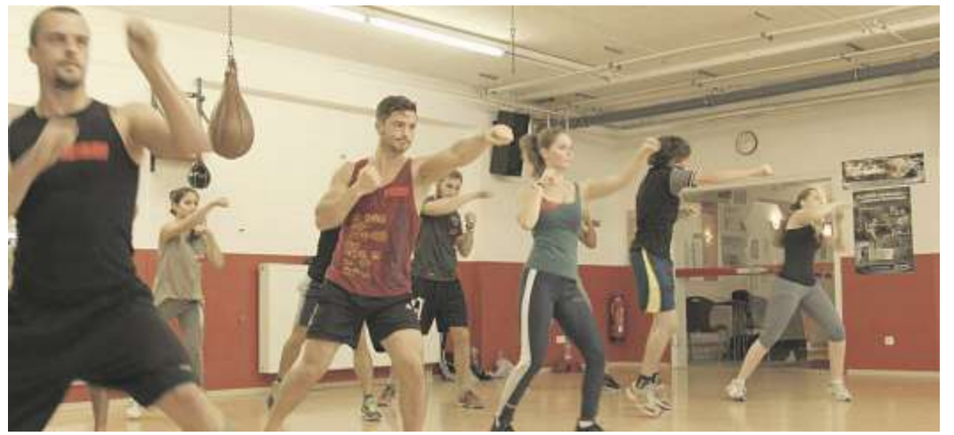
Bei der Students Charity Fight Night am 19. November treten zwölf Sportler in sechs Kämpfen gegeneinander an.

Regensburg. Am Donnerstag, 19. November findet ab 20.30 Uhr im Mylo Grand Club die große Students Charity Fight Night statt. Die Idee: Zwölf Studenten, die zuvor nie geboxt haben, steigen in den Ring und kämpfen für soziale Projekte, die sie selbst ausgewählt haben. Jedes Projekt wird am Ende mit Spendensummen unterstützt, die vom Erfolg des Ticketverkaufs und einer laufenden Crowdfundingaktion abhängen. Das Publikum wird dann nicht nur mit den Kämpfen, sondern auch mit einem Rahmenprogramm unterhalten: Die Country Dudes um Furchtbar-Scheemusiker Uli Groeben werden auf der Bühne stehen, außerdem gibt es eine Aftershow Party. Bis